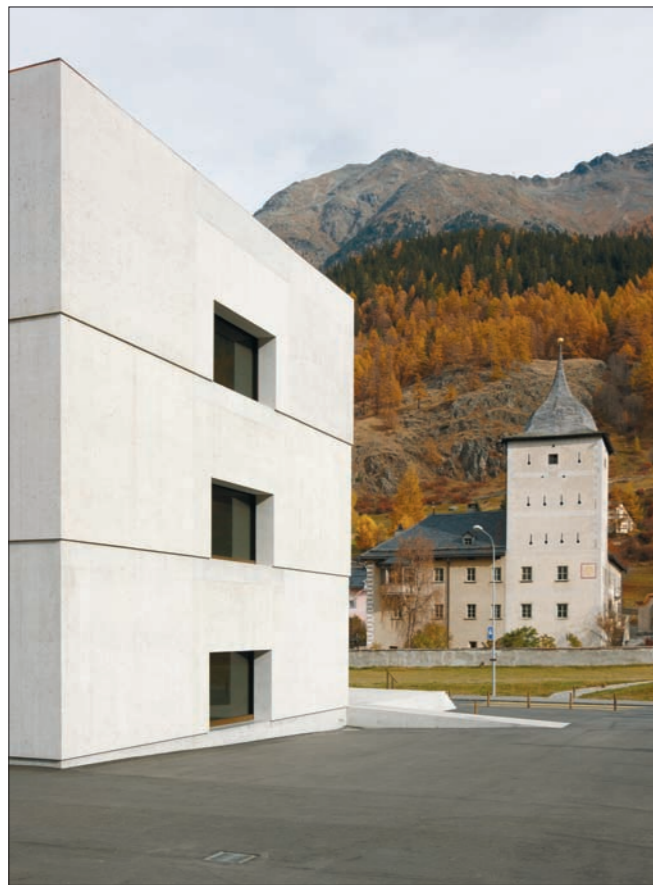
Das Nationalparkzentrum in Zernez von Valerio Olgiati. Im Hintergrund der Plantaturm.

»Die Macher des Buches rufen zum Hinschauen auf – und dazu, das Bauen mit Kopf und Herz neu zu erleben.«